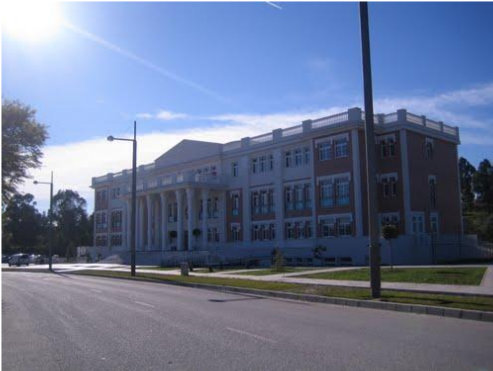
Foto del colegio MIT

Lugar: Colegio Bilingüe M.I.T. Parque Tecnológico de Andalucía C\ Severo Ochoa. Málaga.